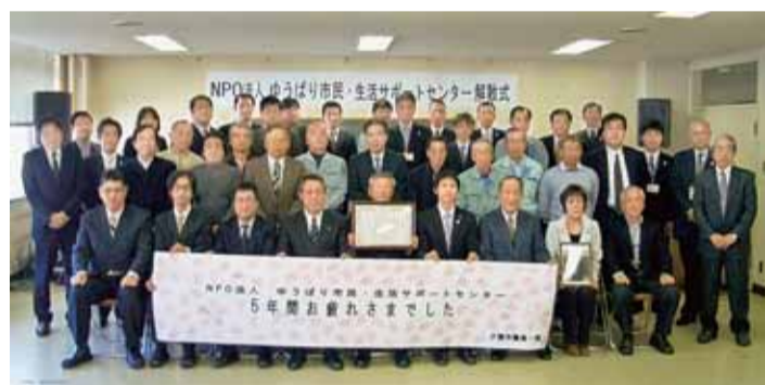
NPO法人ゆうばり市民・生活サポートセンター解散式=3月19日

今後、センター業務の半数は市職員が直接行います。センターは行政支援に一定の成果をあげま