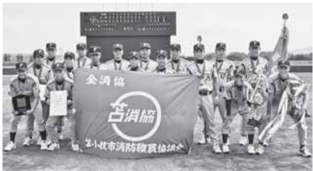
優勝した苫小牧消防協チーム=7月30日、旭川市