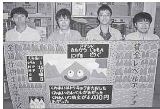
今年のメーデーで作成したプラカードを持つ青年部員