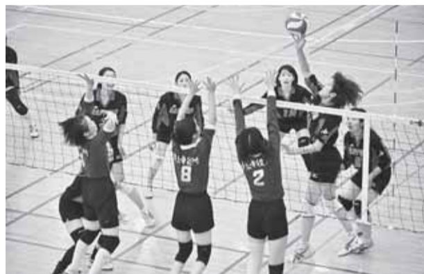
札幌市職連と帯広市労連(てまえ)の決勝戦=7月15日