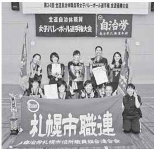
優勝した札幌市職連チーム=7月15日、音更町

7月14日15日の両日、音更町総合体育館で、第34回全道自治体職員等女子バレーボール大会が開かれた。全道から15チームが出場し、リーグ戦を勝ち抜いた10チームが、決勝トーナメントに進んだ。大会では、札幌市職連が連が2年ぶり7回目の優勝を飾り、地元帯広市労連は惜しくも準優勝に終わった。来年9月に千葉県で開かれる全国優勝大会には、札幌市職連と、来年、全道大会で優勝したチームが出場することになる。