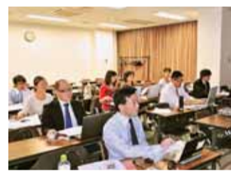
真剣に取り組む参加者