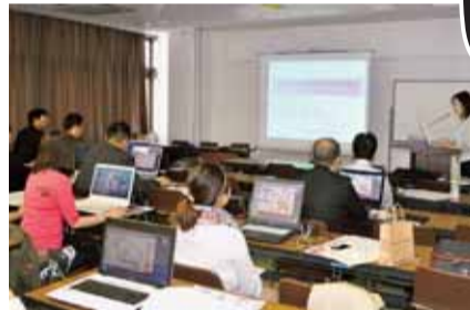
今まで「ワード」を使っていた参加者は、「パーソナル編集長」に感動＝4月25日、自治労会館