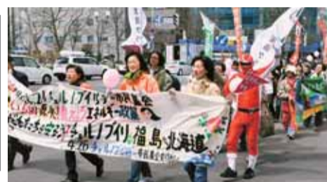
北電までのデモ行進

北電までのデモ行進で、「原発はいらない！チェルノブイリ・福島原発事故を繰り返すな！」とシュプレヒコールをあげた。