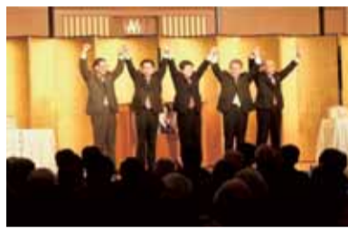
統一選勝利にむけて「総決起集会」12月6日