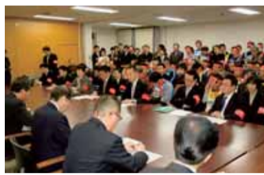
当初予算闘争「地公三」者最終交渉11月18日

世相を象徴する漢字は「絆」 2011年を振り返る 東北を中心とする大震災で人との「絆」の大切さがあらためて見直される2011年でした。