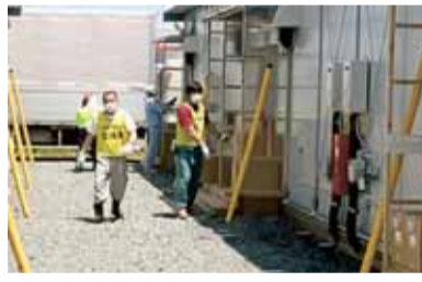
仮設住宅へ「自治労復興支援活動」11月3日