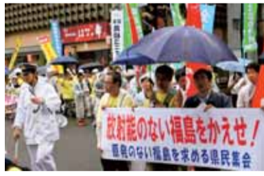
核と人類は共存できない「水禁福島大会」11月31日