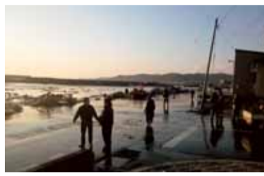
東日本大震災被災地にも「被災者」の浦町11月11日