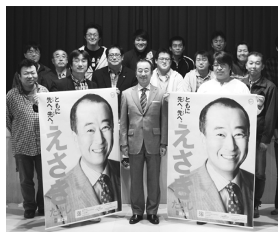
道内の職場まわりで=4月4日、網走地本

◆1956年福岡県三橋町生まれ、法政大学社会学部卒業後、旧三橋町役場入職(現柳川市)、自治労福岡県本部書記長、自治労中央本部労働局長を経て、現在は特別執行委員(公務員制度改革担当)◆家族:妻・息子・母の4人◆趣味:サッカー。夢は現地でのワールドカップ観戦。◆好きな言葉「深い川は静かに流れる」。