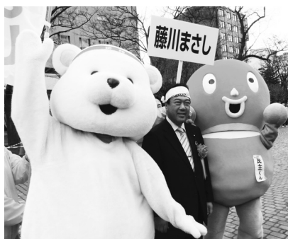
今年のメーデー会場で=5月1日、札幌市

◆1956年苫小牧市生まれ、慶應義塾大学法学部卒業後、札幌市役所に勤務。札幌市職青年部長、組織部長、副委員長、書記長、札幌市労連書記長を歴任。2003年札幌市議会議員当選◆家族:妻・息子・娘2人・母の6人◆趣味:ウォーキング・写真撮影。ちょっとした合間でも撮影します◆好きな言葉「誠心誠意」。