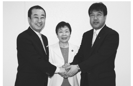
2007年の参院選で当選した、「あいはらくみこ」(中央)と一緒に

ービスを提供する 自治体の『現場』で 「えさきたかし」と 「藤川まさし」は働 いてきました。 生活のほとんど のことが政治の場