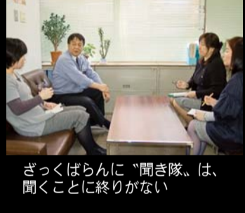
ざっくばらんに「聞き隊」は、聞くことに終りが無い