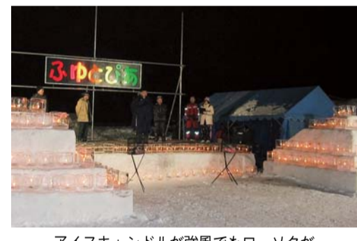
アイスキャンドルが強風でもローソクが消えない工夫をしたキャンドルタワー