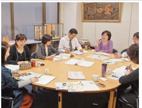
みんなで話し合い、決めたことを分担して回りが深まった。3月31日、道本部会議室

3月24日、第4回男女別統一闘争に向けての委員会の中で、男女平等委員会のメンバーが話し合い、決めたことを分担して回りが深まった。3月31日、道本部会議室