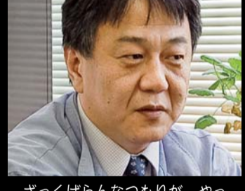
ざっくばらんなつもりが、やっぱり「まじめ」に答えてくれた榎部部長