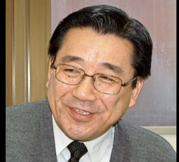
男性の気持ちを、ざっくばらんに語ってくれた山上委員長