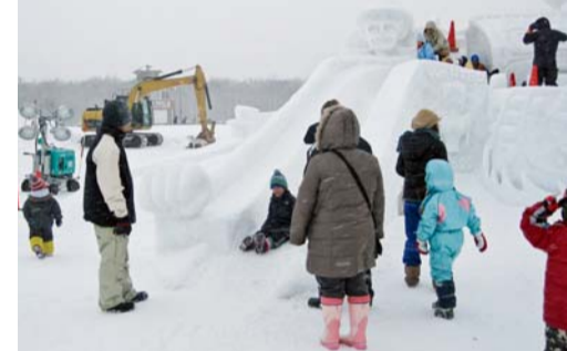
子どもたちは冬ならではの滑り台を満喫しては2月7日、別海町・農村ひろば

【釧根地本発】別海町職は「地域の活性化に貢献することをめざし、イベントへの積極的な参画を活動方針に掲げています。その一環として、2月7日に開かれた「2010ふゆとびあin別海」への取り組みを紹介しました。 このイベントの中で私たちはアイスキャンドルや、キャンドルタワー、雪の滑り台警備などを担っています。キャンドルタワーは縦2m、横5m、高さ2mほどの大きさのものを用意しました。しかし、子どもたちは冬ならではの滑り台を満喫しては2月7日、別海町・農村ひろば