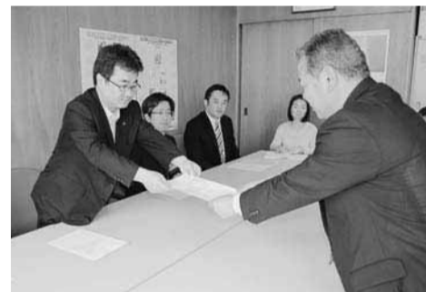
夕張市職労と道本部は、道に「夕張市財政再生計画」策定に関する要請書を提出した＝6月12日、道庁

「夢」を出し合い、予定時間を超過するほどの活発な話し合いの場となった。今回参加者の多くが青年層で、男女産別統一闘争について「初めて知った」という参加者が多かったが、本セミナーで学んだことを活かして今後闘争の推進につなげていくことを期待したい。