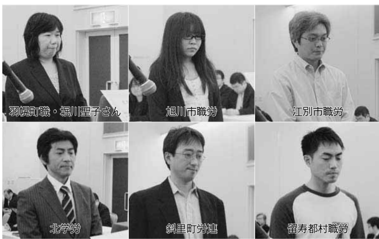
今回、共済の運営・加入促進に貢献し表彰されたのは書記3人と18単組。写真は当日参加者