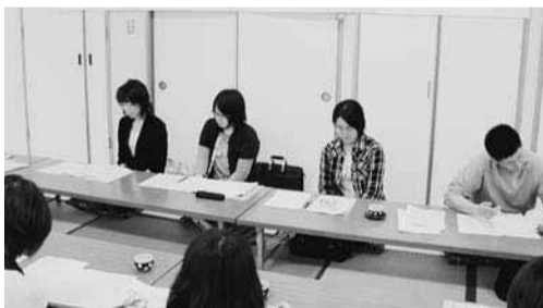
3年ぶりに開かれた函館地方協の女性セミナー＝6月6日、今金町

この2年間開かれず、今回3年ぶりの開催となった。講座「男女平等産別統一闘争」では、道本部・上島女性部長が闘争の意義と目的について