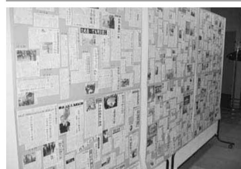
自治研全国集会・夕張分科会で展示した夕張市を報道する新聞記事のパネル

【空知地方本部発】06年6月、夕張市の多額負債報道を契機に自治体財政がクローズアップされ、国は再建法から健全化法への議論を一挙に進めた。