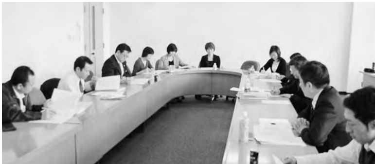
男女がともに担う北海道推進委員会のメンバーは15人

道本部は4月9日、自治労会館で第1回男女がともに担う自治労北海道計画推進委員会を開いた。 委員会は、15人の推進委員会メンバーの確認、第3次計画の推進など委員の任務を確認した。