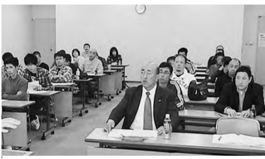
全道で初めて開催した、公共民間労働者集会。各地本での取り組みが目標だ=4月11日、北斗市

4月11日、渡島管内北斗市で、渡島・松山地方本部合同「公共民間労働者集会」が7単組・30人が参加し開かれた。この集会は、道本部公共サービス民間労働協議会幹事会で議論され、その方針を受けて全道で初めて取り組んだ。