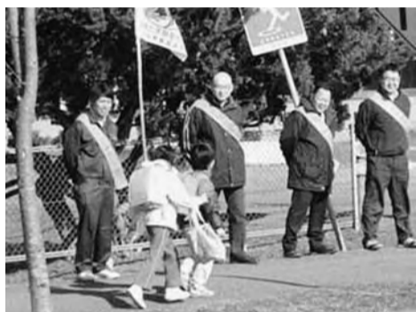
春先に新入学児童に交通安全の街頭啓発活動

同日、交流集会が文化会館で開かれ300人が参加し、再処理工場をめぐる問題点の学習と全国各地のたたかいが報告された。10月3日には、東京で脱原発の1万人全国集会が予定されている。