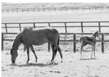
日高は、日本で一番競走馬を生産し、数多くの名馬を輩出しています