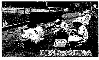
速報を手にする選手たち