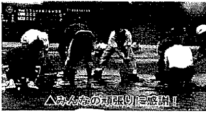
▲みんなの頑張りに感謝!!