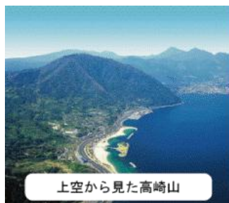
上空から見た高崎山