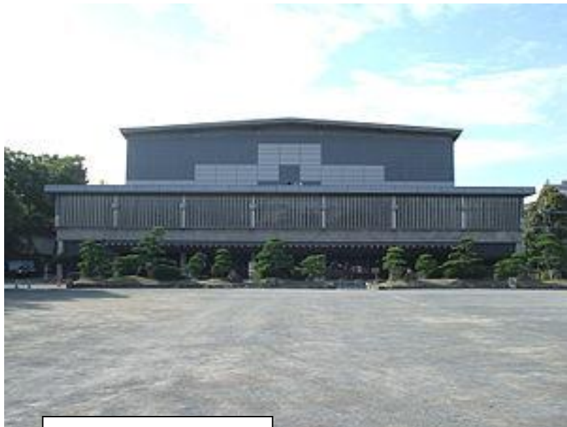
大分文化会館の外観と大分城址公園【上記・右写真】