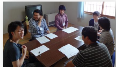
分散会（みんなで日頃の仕事内容や不満を言っています）

日々の業務の中で、「おかしい」と思うことや、「不満」に思うことは誰にだってあるはず。「上司が超勤を付けてくれない」や「仕事量が多すぎて帰れない」といった悩みや不満・不安を分散会や交流会でぶちまけてほしいものです。そこに問題があるから私たちの組合もあります。問題が無ければ組合なんてないんですから（笑）そんな交流をしている一部始終をどうぞ^^（みんな良い笑顔なこと）