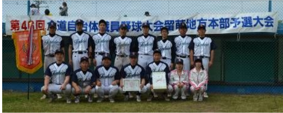
優勝を飾った天塩町職のメンバー

6月9日(土)、16日(土)の2週にわたり、自治体職員等野球大会留萌地方本部予選大会が羽幌町スポーツ公園A球場にて開催されました。 天候にも恵まれ、各チーム気迫あふれるプレーが続出する熱戦を繰り広げたなか、天塩町職が優勝を勝ち取り、昨年に引き続き2連覇を成し遂げ、通算3度目の全道大会への出場権を獲得しました。優勝した天塩町職は7月27日から旭川市と鷹栖町で開催される全道大会に出場します。