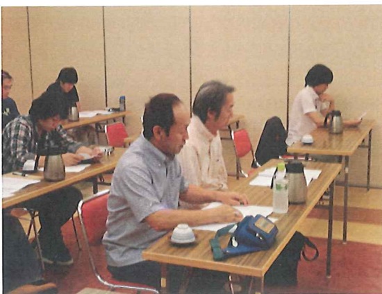
【 単組活動報告 】