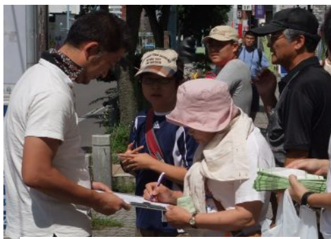
本町交差点での署名活動

8月11日、渡島地区平和運動フォーラム幹事会を労働福祉会館で開かれました。1000万人署名への協力と大間原発建設反対運動強化について話し合われました。それを受け8月17・18日、渡島管内をオルグ、さようなら原発1千万人・大間原発建設中止の署名については組合員1人5筆を目標に、また、各市町村の9月議会に間に合うよう原発に関する意見書の採択に向けてさらなる要請をしました。