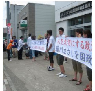
↑蘭越でも横幕を手に激励、喉を潤し、熱中症予防の水も差し入れてくれました。ありがとうございます、元気が出ます