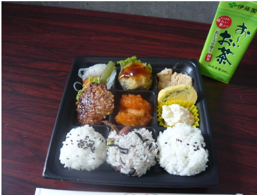
避難所でのおにぎり弁当。（おにぎり3つ、おかずが6品）