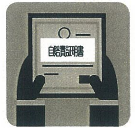
受取希望日にお渡します

車検証と自賠責証 のコピー、掛金をお持 ちください(書記局で コピーもOKです)。