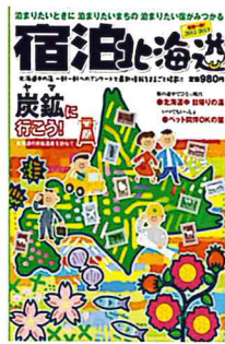
各書店で販売しています

東京都は北海道の産炭地域を紹介するイベントを計画していますが、その一環として炭鉱ナビに写真借用を依頼してきました。 期間は6月29日～7月5日で第一本庁舎南塔45階に展示される予定です。 炭鉱ナビでは「第5回北海道炭鉱遺産写真コンテスト」入賞作品を提供する準備を進めています。