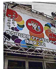
ほのぼのとした映画祭の看板