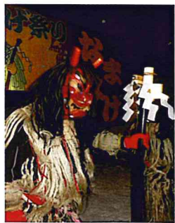
「いい子にするか〜」赤鬼の登場