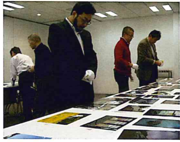
真剣な写真コンテスト審査風景

応募作品全体を見渡すと、釧路や浦幌、白糠や羽幌方面からの作品が多くなり、新しい応募者も増えています。四季折々の旧炭鉱施設の景観に加え、人物・動植物・自然現象等を配したり、往時の暮らしや作業をイメージさせ