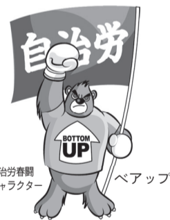
自治労キャラクター