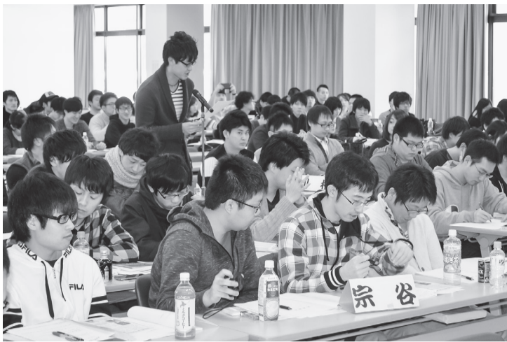
15本の発言により、春闘方針を補強