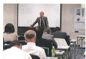
11/21 自治体議員連合学習会にて国政報告をさせていただきました。