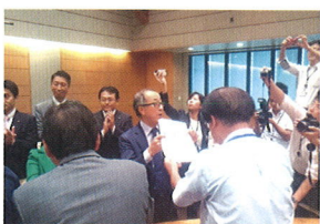
10/5 「戦争法の廃止を求める2000万人統一署名」の第2次提出行動に参加し、代表して署名簿を参議院に提出しました。