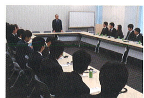
10/25 大阪交通労働組合青年部の皆さんが、研修の一環で国会事務所を訪問・意見交換されました。