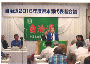
7/28 自治退県本部代表者会議に出席し、参議院選挙の報告とご挨拶をさせていただきました。