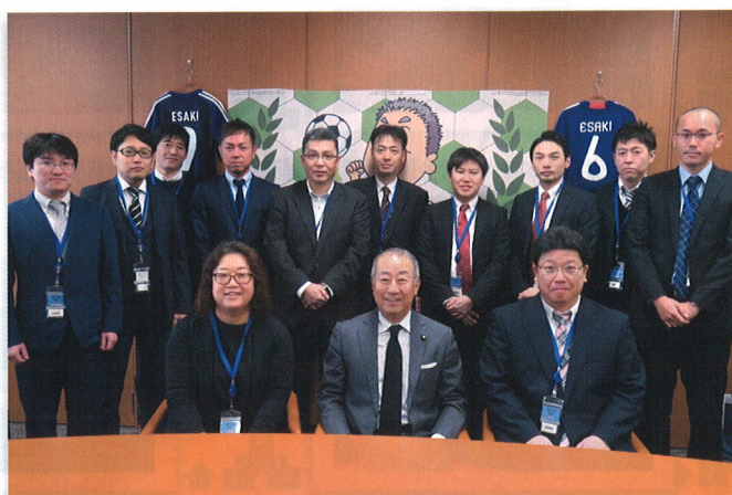
▲国会事務所を訪問された国保労組幹事の皆さんと

政府・与党はこれまででも、経済優先を掲げて国民の目を逸らせながら、特定秘密保護法や安保関連法、改悪労働法制などを強行に成立させてきました。しかし、