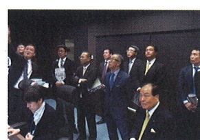
12/5 参議院総務委員会によるNHK放送センターの視察に参加し、新センターの建て替え計画などについてヒアリングしました。