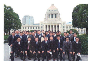
11/2 広島県本部大都市評議会と県本部役員の皆さんが国会訪問され、意見交換をさせていただきました。