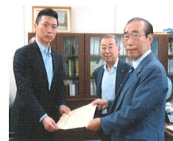
9/13 地公退が毎年行っている総務省への申し入れと意見交換会に同行しました。