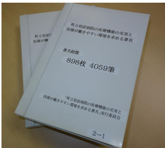
【集まった4059筆の署名】