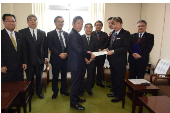
【民進党会派への要請書を提出】

11月29日(火)道議会庁舎において11月19日、20日に集中期間として実施した「町立松前病院の医療機能の充実と医師が働きやすい環境を求める署名」4059筆を提出した。