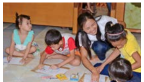
ベトナム／ハイフォン市の障害児教室への支援

エファジャパンの活動を通じて、アジアの子どもの権利を守る取り組みを続けています。