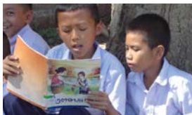
ラオス／図書館・学校図書室設置、運営支援