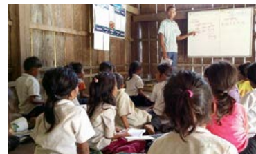
カンボジア／国境地帯の寺子屋教室運営支援