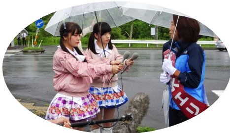
↑北海道のローカルアイドルユニット・フルーティのインタビューを受けました。「政治家を目指した動機、若者に一言」(4日千歳)