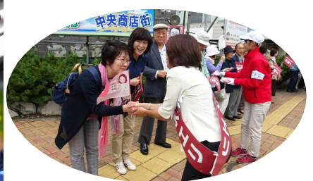
↑↓温かい激励をいただいて闘い抜く元気をいただいています。ありがとうございます(4日北広島・江別)