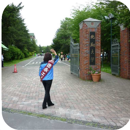
↑「若い皆さ〜ん、投票に行ってください〜」大学前で支援を呼びかけました(4日江別)