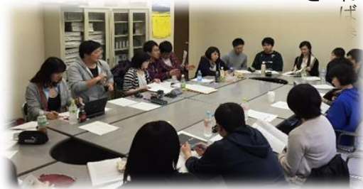
<函館地方協実行委員会の様子>