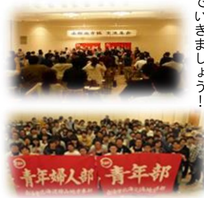
前回の函館地方協

今年は2年に1回、全国の自治労の仲間が集まる青年女性中央大交流集会在7月29日から31日の日程で山梨県にて開催されます。自分たちの職場の実態や思いを伝えるためには実際に仲間と話すしかありません。ですが、単組の予算や、業務の都合で参加したくてもできない人がたくさんいます。そんな思いを持っている人はぜひ、地方協に参加して、参加者と討論をする中で自分の思いをしつかりと伝えましょう。そうすれば必ず中央交に参加する仲間が代わりに伝え、聞いて全国の実態を学んで皆さんにフィードバックしてくれるはず。そのためにも貴重な機会になる各地方協に一人でも多くの仲間の結集できるように各単組、各地本で取り組んでいきましょう!