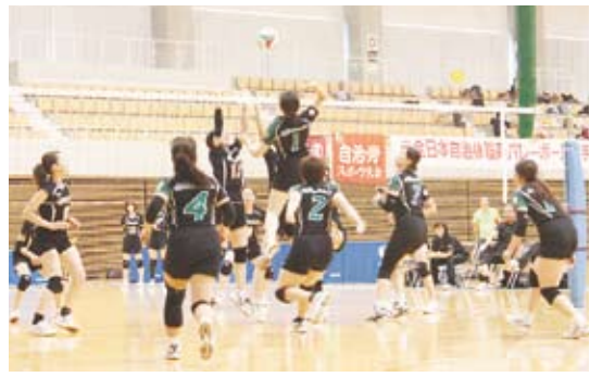
札幌市職連 VS 松本市職労