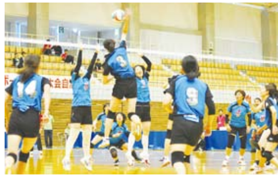
札幌市職連 VS 豊中市職