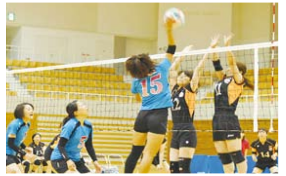
豊中市職 VS 島根県職出雲