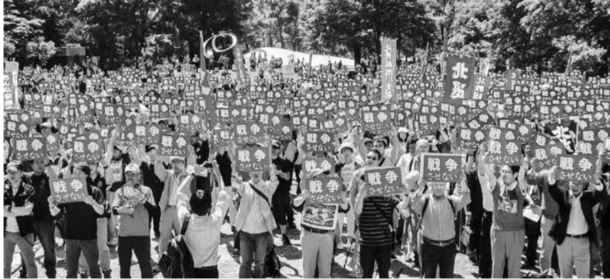
5500人の市民が参加した大集会。「戦争をさせない」メッセージボードを掲げた=6月20日

岩本一郎・北星学園大 学教授は「今、人類に必要なのは、戦争による暴力ではなく、世界中の人々と友人になることだ。『隣人が優しい』と