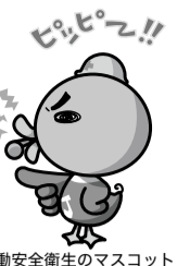
労働安全衛生のマスコット「危険カモ」

図5 事務職場におけるヒヤリハット事例 扉に小悪をつけ、反対側の様子が見えなくなる。良い対策ですが、それが出来ない時は、次善の策として、扉の引き手側に注意書きを目線の高さに取付けましょう。また、引き手側の立ち位置にも注意しましょう。 【内容】 入退出に際し、ドアを開けた際に反対側にいる人にぶつかりそうになった。 【原因】 反対側の様子が見えない。 【対策】 扉に小悪をつけた。