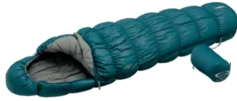
寝 袋・シュラフ（個人）