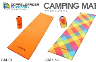
ア ルミマット（個人）