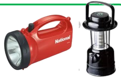
懐 中電灯（単組・個人）