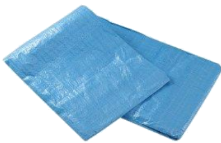
フ ルーシート（地本・単組）

テントには床部分に敷くのと、全体集会で座るために、各地本毎にブルーシートが必要です。