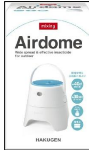
火を使わないタイプが安心 ですね。