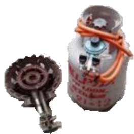
カ スコンロ（実行委員）

食材を冷やすだけではなく、保管箱としても重宝します。M岡S造の熱にも対応できます。