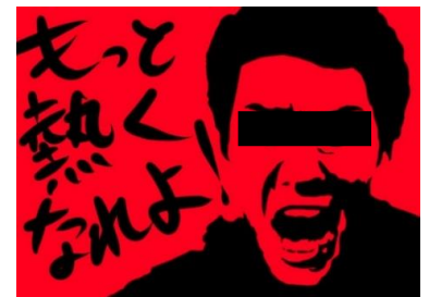
熱 い気持ちと ア ンケート