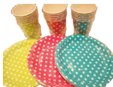
食 器類・ 洗 剤