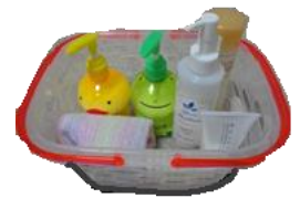
風 呂用具&タオル等（個人）

洗顔や歯ブラシはもちろん、タオルは必須です。お風呂に入る方は、ほかにもご用意ください。