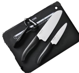
調 理器具・ 調 味料（地本・単組・個人）