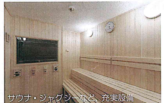
サウナ・ジャグジーなど、充実設備