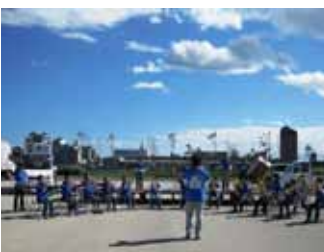
東小学校:金管バンド