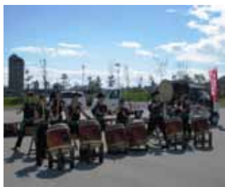
函館巴太鼓(ジュニア)

10月4日(土)函館市『緑の島』において、第5回食と環境まつりが開催されました。