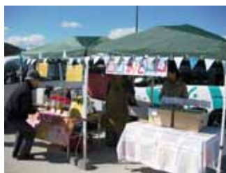
全道庁労連:花林糖等販売

アジア・アフリカ飢餓難民への支援米の取り組みと、『食』の安心・安全を見つめ直すきっかけとして、地元道南の食材を使った地産地消の推進を、農業・漁業・消費者・労働組合関係者が連携して、毎年イベントを開催しています。