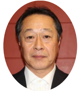
衛生医療評議会事務局長