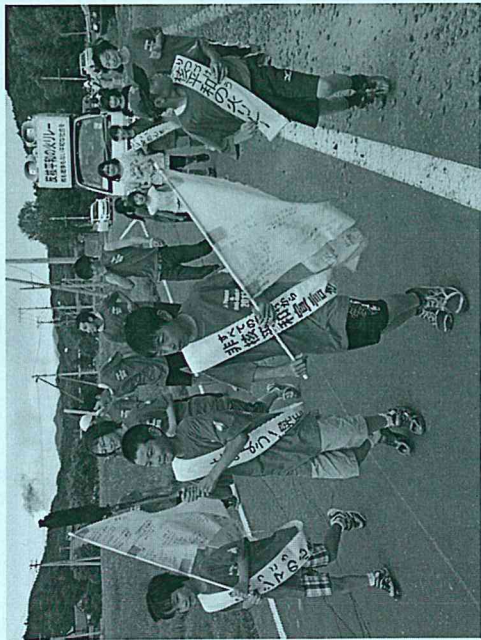
子どもたちに核も戦争もない未来を！

【日本国憲法前文】抜粋 政府の行為によつて再び戦争の惨禍が起ることのないやうにすることを決意し、ここに主権が国民に存することを宣言し、この憲法を確定する。