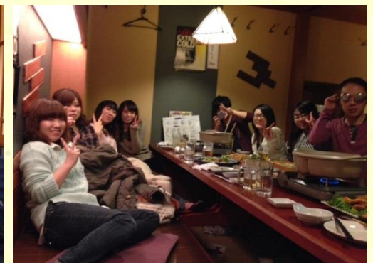
華やかな女の子たちとウルトラマン(右端)