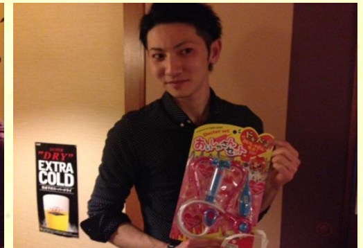
おもしろさんセットをゲットして喜び片0くん