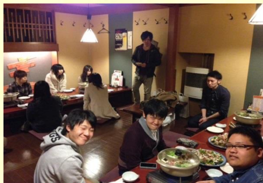
司会を務める馬渡福利厚生部長と変顔3人組