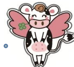
イメージキャラクター モージェル