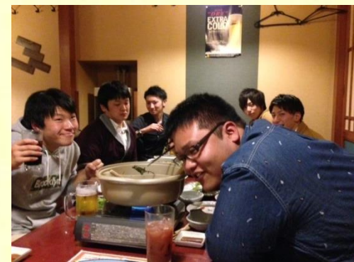
表情豊かな男子部員一同