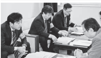
道市町村課との交渉の様子