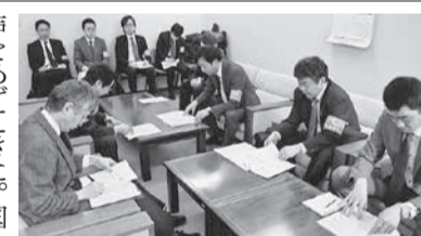
道市町会との交渉の様子

給与削減の地公給与への波及問題では、市長会として例にない記者会見を設けるなど地方自治の根源に関わる問題として、国と道に対して要請を行う、全国市長会の中でも