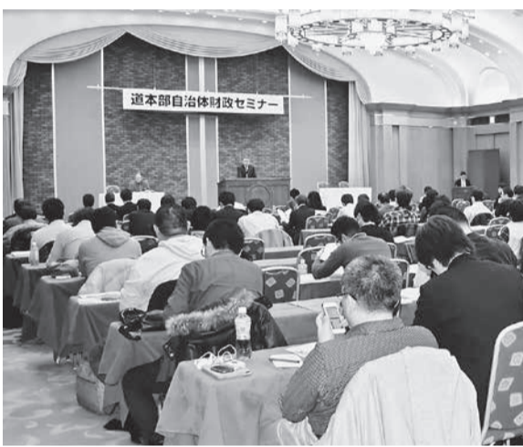
第二部には250人が参加した＝札幌市・ホテルライフオー

2月15日、2014年度道本部自治体財政セミナーを開催し、140人が参加した。今年、地方財政確立道民会議(連