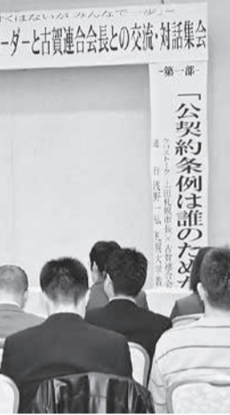
80人が参加し、古賀会長と意見交換を行った＝2月14日

最後に、古賀連合会長は、「連合は国に対し公契約基本法の制定を求め、自治体の後押しをした。人や働くことをモノ・カネと并列に社会と対峙し、人間らしい生活の上に経済と社会が成り立つことを徹底訴えていく」と述べた。