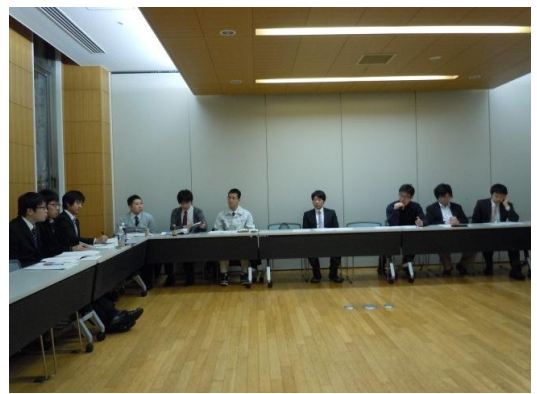
かなり寒い中、活発な討論をしていただいた参加者の方々