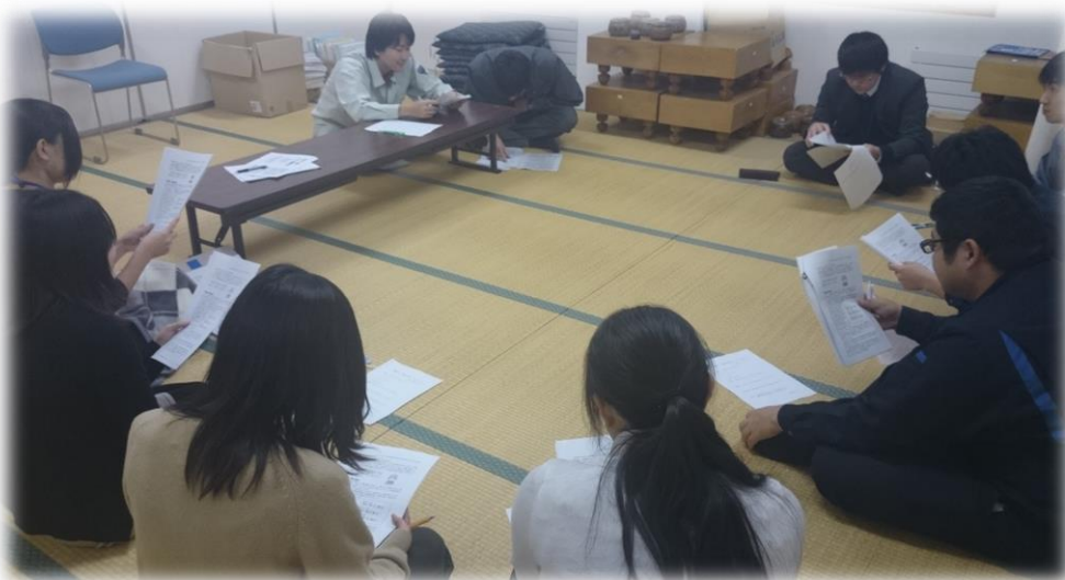
賃金リーフ読み合わせ会の様子 ←

読み合わせ後は、アンケートを記入してもらいました。アンケートからは、「賃金について復習することが出来た」や「不景気だから賃金が削減がされるとするのは、おかしい事だと気づいた」といった意見がありました。当たり前になっていることに対して、「おかしい」と気づく事は中々難しいと思います。賃金削減やサービス超勤も当たり前になっていますが、決して当たり前ではないのです。改めて自分達の賃金について考える機会になったと思います。