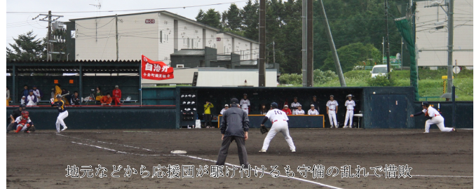
地元などから応援団が駆け付けるも守備の乱れで惜敗

か後度のへ開2優 で志のな、の催0勝 開全道な、はは 催道全道、はは 本道全道、はは 二道全道、はは 七道全道、はは コ道全道、はは 町道全道、はは 大会全道、はは は道全道、はは は道全道、はは