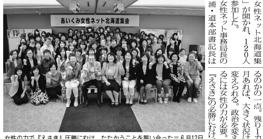
女性ネットワーク北海道集会

非正規職員対象の職場オルグで、自主福祉活動を重点的に提起し9人を組織化できたが、この間の取り組みを総括し、これからスタートと位置づけ、今後の運動を考えあつていきたい。自治研活動として行っている