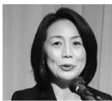
徳永エリ参議も集会に参加し決意を述べた

基調講演では、「労働法制に関する動向」～男女平等関連を中心に」というテーマで、連合総合男女平等局・富高裕子局長が講演した。富高局長は、日本の女性労働の実態について、「女性の労働力率は30代で低くなるM字型カーブ