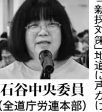
石谷中央委員 (全道庁労連本部)

人事評価制度について、慎重な制度設計を道当局に求めた。8号俸給表を使わず6号のみとして、30歳以下の職員に係る勤手当の運用に前向き姿勢が示された。新採対策は、労金・共済の加入を含め地道に声かけし組織強化・拡大を