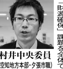
村井中央委員 (空知地方本部・夕張市職)

財政再建計画が設置されて10年目、住民の失望が長く、社会人経験者の採用で空白の年代を埋めている。将来の組織を担っていくのは若年層だが、組織を強化するうえで、社会人経験者層への指導も必要になっている。第13次組織強化方針で社会人経験者への対応が必要ではないか。