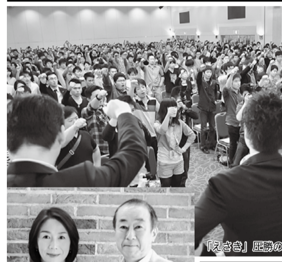
「えさき」 圧倒的意思を固めた

【総決起集会】には、徳永エリ参議院も参加し、「安倍政権の暴走を止めるため何としても勝つ」と決意を述べた