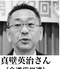
石狩中央委員 (石狩地方本部・全道庁労働職員)

自主福祉活動担当 組織強化・拡大担当 臨時執行委員を配置 自主福祉活動担当 組織強化・拡大担当