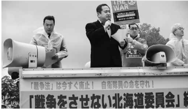
総がかり行動には、市民ら約300人が参加した=6月1日

6月1日、札幌市内で「戦争をさせない総がかり行動」が開かれ、市民ら約300人が参加した。道平和運動フォーラム・山木代表は、「5月23日、鹿追町の陸上自衛隊然別演習場で空包訓練に実弾を撃ち、負傷者が出た。調査委員会が立ち上げられたが内容は不十分で防衛省のHPのどこにも記載はない『安倍政権によって報道規制されている』という疑念が湧いてくる。南スーダンへ自衛隊員が派遣されている