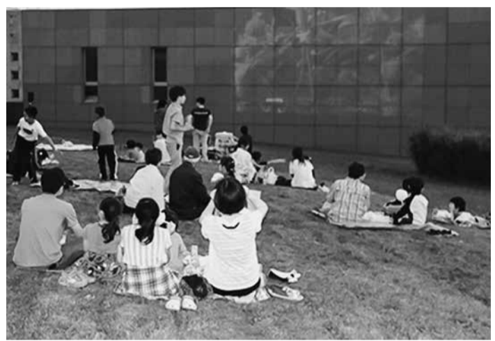
自由な雰囲気を感じられる『ほしぞら映画会』。ぜひ一度ご覧ください

初は共和町職の自治研推進部を母体とする「声を上げまちなりの会」の発案により、「美術館は町全体の財産。みんなが思うようになればいい」との考えから、実行委員会を立ち上げました。実行委員会では星に見立てたキャンダルを飾ったり、屋台を出店したりしながら、野外イベントの自由な雰囲気を感じられるよう工夫しています。映画は無料で鑑賞することができま。ぜひ一度、共和町にお越しください。(後志地本・楠美)