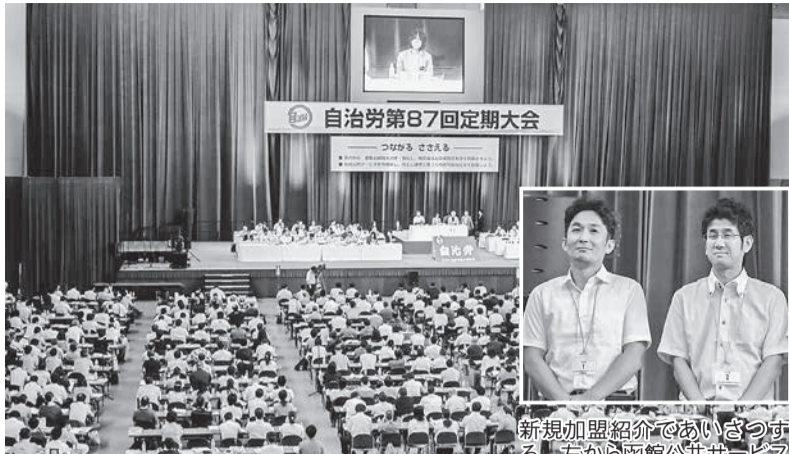
全国から約3200人が参加し活発な討論が行われた = 8月28日、別府市

8月28日(土)29日、自治労第87回定期大会が、分県別府市のビーコンプラザで開かれ、代議員と傍聴者を含む、約3200人(女性代議員数213人・26.5%)・北海道から122人、女性27人が全国から参加した。中間年大会は、昨年の大阪大会で決定した運動方針の中間総括が行われたほか、「当面の闘争方針」など4議案が提案された。議論は人事院の「給与制度の総合的見直し」や「新たな政治対応方針」を中心に活発な討論の結果、議案はすべて可決された。