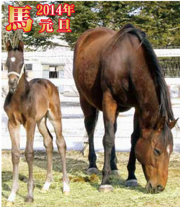
新冠町・ノースヒルズの「キズナ号」(写真左)。母馬「キャットクイル」(写真右)。キズナ号は、2010年3月5生・青鹿毛、父はディーインパクト。まだ震災の傷痕が癒えない日本列島を勇気づけるべく命名された

2013年は地公給与削減反対・参議院議員選挙・改憲にむけた法案阻止などのたたかいだった。結果をしつかり踏まえ、2014年度は労働組合の基本を組合員全員で確認し、各単組の問題点を克服し、自治労運動に結集しよう!