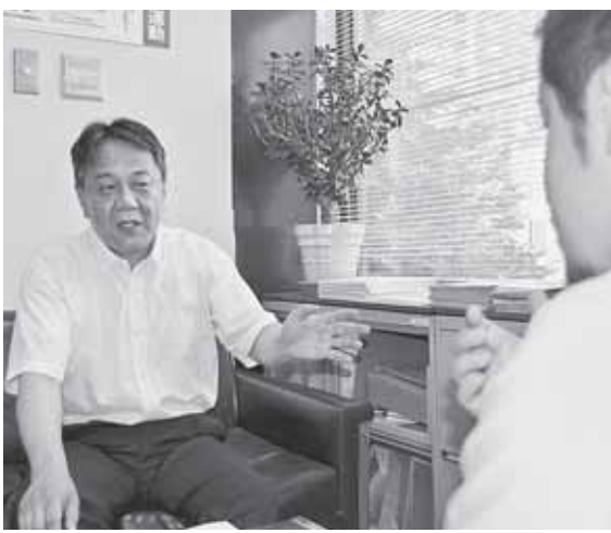
檜部賃金労働部長に話を聞く引地書記