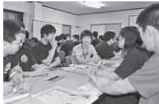
北海道団で行った分散会