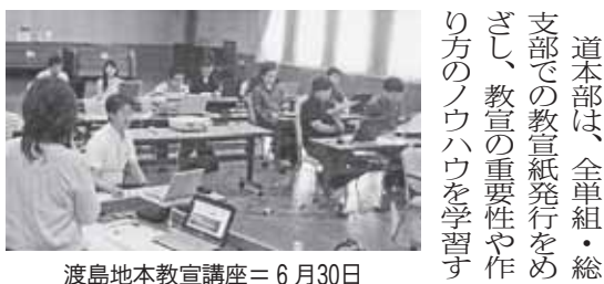
道本部は、全単組・総支部での教宣紙発行をめざし、教宣の重要性や作り方のノウハウを学習する