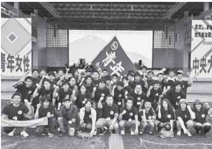
北海道参加者・全道から48人が結集した=7月6日山梨県・山中湖