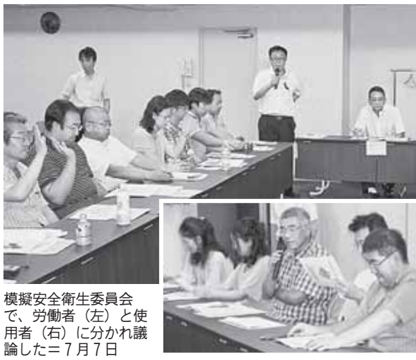
模擬安全衛生委員会と使用者(左)に分かれ議論した=7月7日

体となっている。また、職務の複雑・多様化、人員不足で、直面するメンタルヘルズ問題の解決が進まず、快適な職場環境づくりをどう進めるかが課題となっている。 講座では、上野満雄自治労顧問が「職場のメンタルヘルズ」と題し、従来のうつ病とは逆の症状を示す「新型うつ病(下記参照)」の実態を講演し、専門家のケアやケループワークや研修で、認知度や理解度を高める必要があると指摘した。 その後の模擬安全衛生委員会では、参加者が労働者と使用者に分かれ、2つの議題に従って議論を交わした。