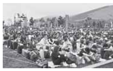
全国から約2000人が結集した参加者