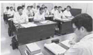
人事院北海道事務局と交渉=7月3日

態に基づいた要求が出され、昨年、臨時特例法による賃金削減で苦渋の決断をしたにも関わらず、人勧が出されたことに抗議し、「今年の勧告は必要ない」と申し入れた。これに対し、人事院北海道事務局長は「これから検討する。要望は人事院へ伝える」と回答した。