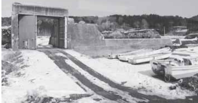
破壊されたままの田老地区防潮堤＝3月4日