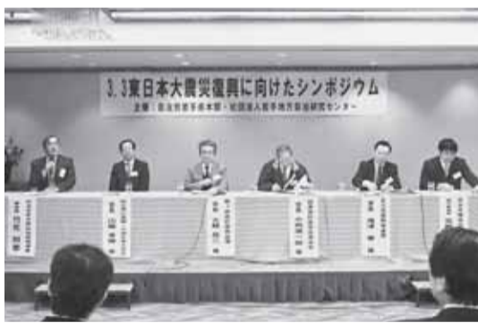
シンポジウムに130人が集った＝3月3日、宮古市・ホテル沢田屋