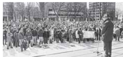
2500人が参加した集会=3月11日、大通西8丁目