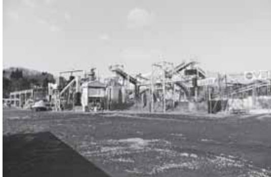
藤原埠頭のがれき選別プラント＝3月4日