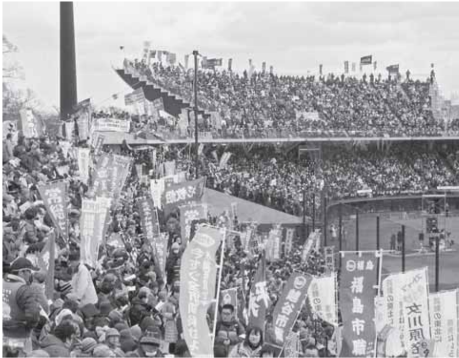
「安心して暮らせる福島をとりもどそう」と1万6000人が集った福島県民集会＝3月11日、福島県郡山市・開成野球場