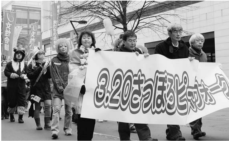
今年3月20日で、イラク開戦から5年が経過した。この日、世界各国で平和を願いピースウォークが行われている。

平和運動公園には、Jリーグチームの合宿に使用される前面天然芝のサッカーコートがあり、ゴールデンウィークには小学生のサッカー全道大会が予定されている。夕張市の降雪量は例年並とはいえず当日の積雪は60cm。自然融雪では間に合わない可能性がある。雪割りは、昨年までは市が行っていたが予算確保が困難でまったく手付かずの状態のため急遽のボランティア行動となった。