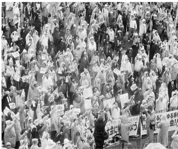
県民大会には6000人が参加し、日米地位協定の抜本改正を求めた

「米兵によるあらゆる事件・事故に抗議する県民大会」は、3月23日午後2時から沖縄県北谷町の北谷公園野球場前広場で、大雨の中6000人が参加して開催された。大会は日米地位協定の抜本改正などを求め、宮古島、石垣島でも開かれた。「私たちに平和な沖縄を返してください」と、繰り返される米兵の事