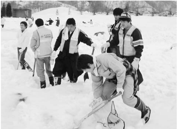
春先の雪の重量は腕にひびく大変な作業だ＝3月20日、夕張市平和運動公園

3月20日、夕張市平和運動公園で、ゆうばり市民・生活サポートセンターと連合北海道の組合員70人が、夕張市内の平和運動公園で雪割りを行った。自治労からは、空知地方本部を中心に46人が参加した。