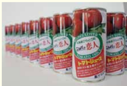
トマトジュース (平取町)