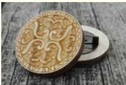
ピラッキー (平取町)