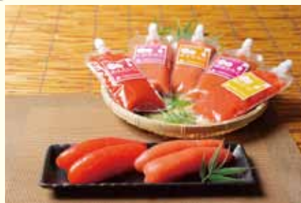
たらごもり (古平町)