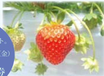
すずあかね (うらかわ産夏いちご)