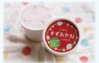
うらかわすずあかねのアイス