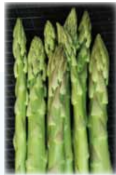
うらかわ産夏アスパラ