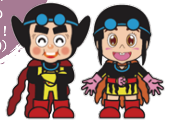
こんぶマン・こぶねちゃん

8/1月～5金の期間 太陽の瞳 (ミニトマト) ひだかホエー豚 しずない産ななつぼし※5日限定 を使ったメニューが ポールスター札幌の レストランに登場! (1F Dining&Bar 179)